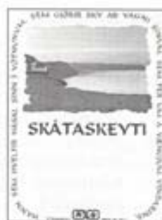
3. Frá Úlfjótuvatni