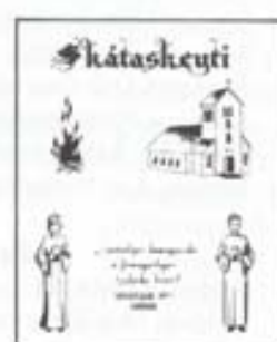
Mappa utan um skeytin Öll skeyti eru send út í svona möppu