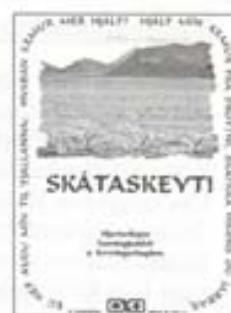
4. Fljúgandi svanir