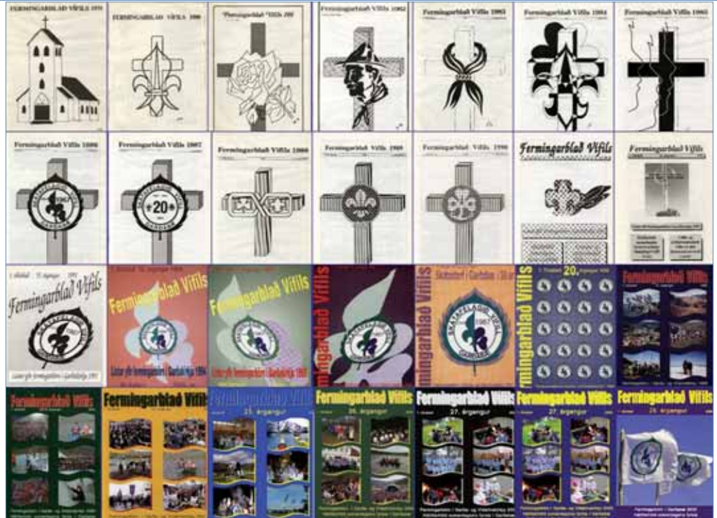
Fermingarblöðin hafa verið skönnuð inn og verða sett á vef Vífils

Með Fermingarblaði Vífils, sem er alfarið unnið af skátum Vífils, viljum við einnig kynna allt það umfangsmikla starf sem fer fram í Garðabæ.